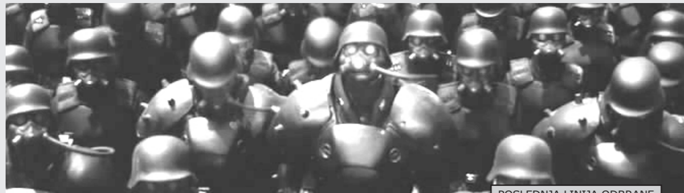
POSLEDNJA LINIJA ODBRANE