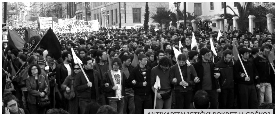
ANTIKAPITALISTIČKI POKRET U GRČKOJ

U prethodnoj godini videli smo rađanje masovnih antikapitalističkih pokreta, prouzrokovanih krizom. Videli smo milione radnika, migranata, i drugih obespravljenih na ulicama gradova širom sveta.