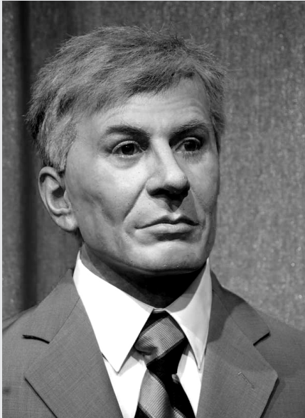
VIZIONAR OD VOSKA - EKSPONAT IZ MUZEJA U JAGODINI

Kult ličnosti Zorana Đinđića koristi se, od strane gotovo svih političkih partija u Srbiji, kako bi se pljačkaškim stavovima ovih organizacija dalo idejno zaleđe. Takođe, veliki broj, pogotovo mlađih ljudi, zgroženih zločinačkim šovinizmom prethodnih ratova, u Zoranu Đinđiću i u onima koji se pozivaju na njegov kult, vidi alternativu. Na godišnjicu njegove smrti, sećanja na njegovo delo ponovo izbijaju u prvi plan, pa smo i mi odlučili da se pozabavimo tom temom. No, budući da nismo želeli da nas optuže za jednostranost, shvatili smo da je najbolje da iz usta samog Đinđića čujemo šta je zapravo govorio, kakve je stavove zastupao, kakvu je politiku sprovodio, i šta je mislio o ratovima, privatizaciji koja nas je sve osiromašila i drugim temama*: