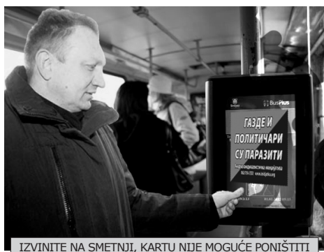
IZVINITE NA SMETNJI, KARTU NIJE MOGUĆE PONIŠTITI

Kada bi izbori mogli išta bitno da promene, država bi ih odavno zabranila.