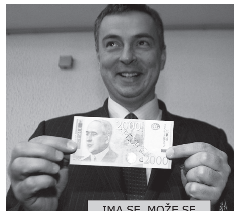
IMA SE, MOŽE SE

Dok pokušavamo da sastavimo kraj sa krajem stiže vest da će nam uskoro na vrata zakucati privatni (tzv. profesionalni) izvršitelji. Kakva su ovlašćenja ovih legalnih otimača? Oni će moći da iseljavaju iz stanova i kuća,