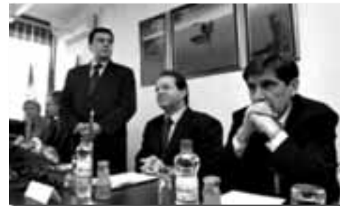
Da li je sada jasno da je socijalni dijalog dijalog

moguće postojanje socijalnog dijaloga koji će ostvariti i interese radništva i interese gazda. Naši interesi su suprotstavljeni – interes gazda je da radnici što više rade, a da budu plaćeni što manje, dok je interes radnika da, u ovom i ovakvom društvenom uređenju, što manje rade, a da za taj rad budu plaćeni što više. Jasno je, dakle, da je priča o zajedničkim interesima, koje treba utvrditi i sprovesti u delo socijalnim dijalogom, samo prazno ble-