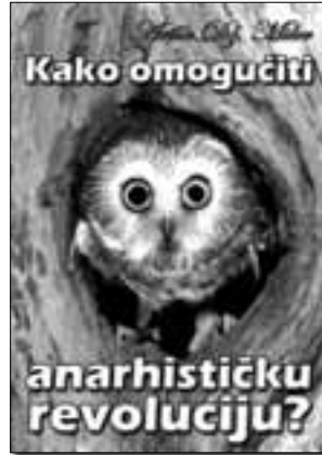
Artur Dž. Miler „Kako omogućiti anarhističku revoluciju“

Tekst pruža uvid u pogled jednog anarhiste koji pokušava da odgovori na pitanje kako omogućiti anarhističku revoluciju u modernom društvu.