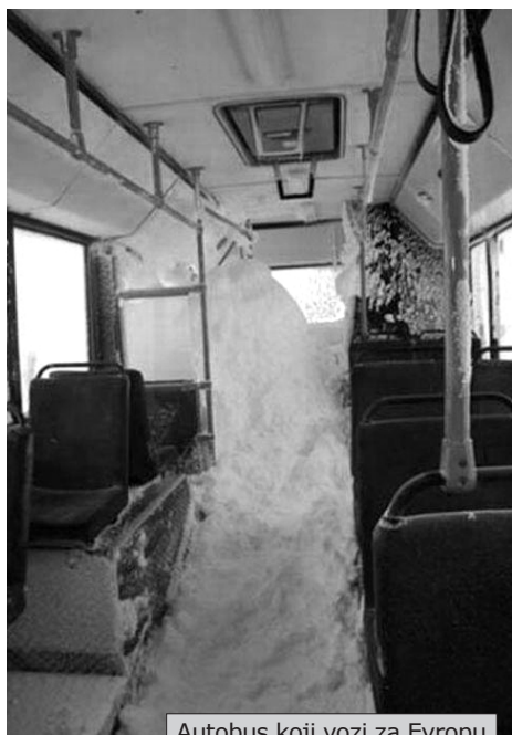
Autobus koji vozi za Evropu

U Evropi, kojom se već deset dana širi ledeni talas, više od 400 ljudi je izgubilo živote usled hladnoće. Veliki broj njih su bili beskućnici, ali je sve veći broj slučajeva smržavanja u stanovima. Države koje dominiraju planetom, tvrdeći da stoje na braniku Civilizacije, kao SAD prilikom nedavnih udara uragana, jasno pokazuju da nisu zainteresovane, niti sposobne, da efikasno brane interese „svog“ stanovništva. U Srbiji, predatorska uprava Elektrodistribucije najavljuje da će i pored rekordno niskih temperatura seći struju onima koji nemaju da plate. Ima li boljeg primera monstroznosti kapitalističkog sistema? Činjenica da su najmlađi članovi društva, barem na neko vreme, oslobođeni stega represivnog obrazovnog sistema time što