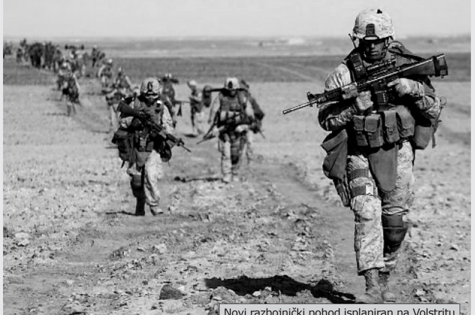
Novi razbojnički pohod isplaniran na Volstritu

Čak i ako rat ne počne već za nekoliko dana, za par nedelja, ili u aprilu, kako se sve češće najavljuje u medijima, jasno je da svi međunarodni akteri očekuju rat širih razmera u neposrednoj budućnosti. Ratova će biti dok god postoji kapitalizam, poredak koji stvara velike svetske klanice kad god