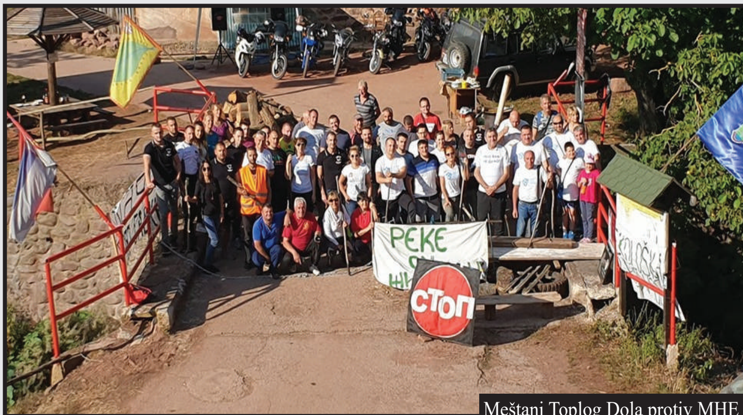
Meštani Toplog Dola protiv MHE