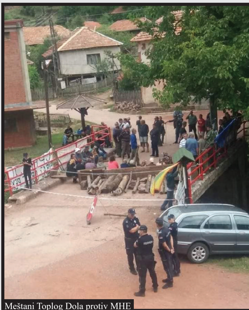
Meštani Toplog Dola protiv MHE

Samoorganizovana odbrana i borba, sve više se širi i pokazuje da je narodu otimača, izvršitelja, investitora, političara, tajkuna i drugih parazita preko glave, kao i da je jasno da pravdu moramo da uzmemo u svoje ruke!