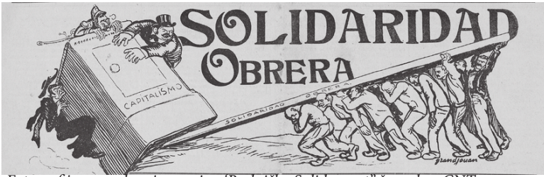
Fotografija sa naslovnice novina "Radnička Solidarnost" španskog CNT-a

Pre samo nekoliko godina, naši saborci i saborkinje iz Bugarske – koja je u dosta sličnom socijo-ekonomskom i geopolitičkom položaju kao Srbija, uspeali su da pokrenu kampanju zajedno sa radnicima iz lanca supermarketa i u roku od godinu dana primoraju državu na ogromne ustupke. Pikadili lanac supermarketa u Bugarskoj je tokom 2016. i 2017. godine krenuo sa zatvaranjem pojedinih radnji, kašnjenjem i neisplaćivanjem plata i otkazima, a u Februaru 2017. godine sud je proglasio bankrot ove kompanije. Lanac je zapošljavao hiljade radnika širom zemlje.