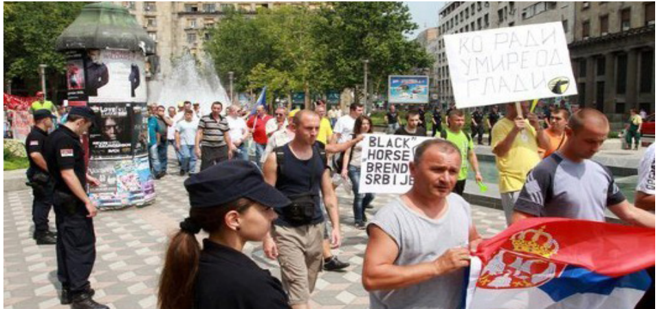
Fotografija sa jednog od protesta radnika FAS-a u Beogradu

Za pomoć u borbi za isplatu zaostalih zarada, radnici FAS-a, kao i radnici i radnice ostalih firmi, koji su zakinuti za sopstvene zarade i ostala radnička prava, mogu nas kontaktirati na: 063 1165551.