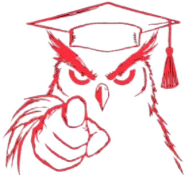
Logo samoorganizovane grupe Studenti u blokadi

Sve što smo mi studenti do sada postigli desilo se zahvaljujući samoorganizovanju po principima neposredne demokratije i plenumskog zasedanja. Plenum je otvoreni forum za sve članove jednog kolektiva, gde svi ravnopravno predlažu tačke dnevnog reda, diskutuju o njima i donose odluke na osnovu glasanja proste većine. Nasuprot ustaljenom modelu predstavničke demokratije, gde se sva moć i odgovornost prepuštaju izabranim predstavnicima koji