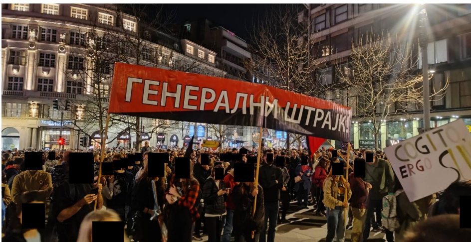
Fotografija transparenta našeg sindikata sa Osmomartovskog protesta u Beogradu

Ali protesti su već postali svakodnevnica, pa ne prođe dan da se u nekom gradu Srbije ne odvija protest, blokada, zbor - ili pak sva tri!