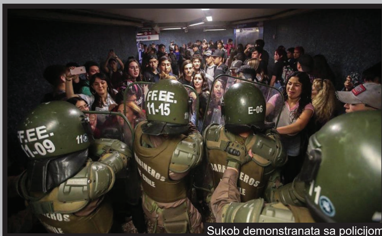
Sukob demonstranata sa policijom

Ono što je zanimljivo, ali očekivano, je potpuna cenzura vesti o ovim velikim događanjima, kako u domaćim, tako i u velikim stranim medijima. Autentičnost protesta u Čileu i Ekvadoru potvrđuje i činjenica da su vlade obe zemlje direktni pijuni SAD, koji sprovode ekstremnu neoliberalnu kapitalističku politiku.