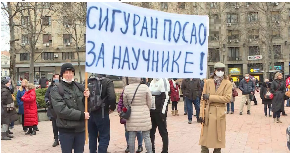
Protest naučnih radnika i radnica, 28. februar 2022. u Beogradu

Oslanjajući se u borbi isključivo na žute strukovne sindikate, korenite sistemske promene nije moguće ostvariti. Neprijatelji svih radnica i radnika različitih struka su isti: država i kapitalizam. Radnice i radnici svih struka svoj radnički položaj radikalno mogu poboljšati isključivo ako se organizuju u nehijerarhijske radničke sindikate, ujedinjeni, solidarni i borbeni!