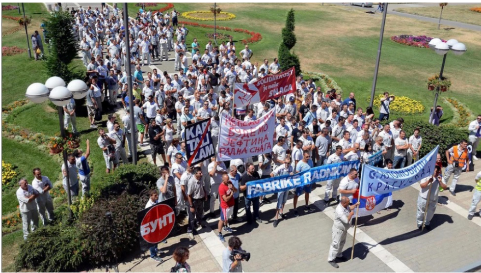
Protest radnika Fiat Plastik u štrajku

Tokom trajanja štrajka iz štrajkačkog odbora su istakli kako Fiat zbog štrajka trpi ogromnu štetu, ali i dalje ne želi da ispuni zahteve. Koliko god skromni zahtevi radnika i radnica bili, u očima gazda i njihovih saveznika - političara, oni su uvek pretnja po visinu njihovog profita, a samim tim i pretnja po eksploatatorski poredak kakav je kapitalizam. Radi se o tome da ukoliko bi se olako pristalo na ispunjenje zahteva radnika, to bi inspirisalo i podstaklo druge borbe, a to nije u interesu sistema.