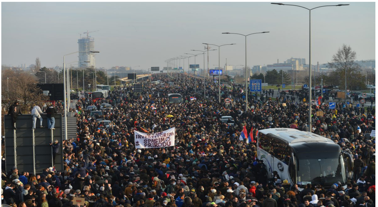
Blokada autoputa u Beogradu - protesti protiv Rio Tinta

Uključite se u borbu - pridružite se našem sindikatu!