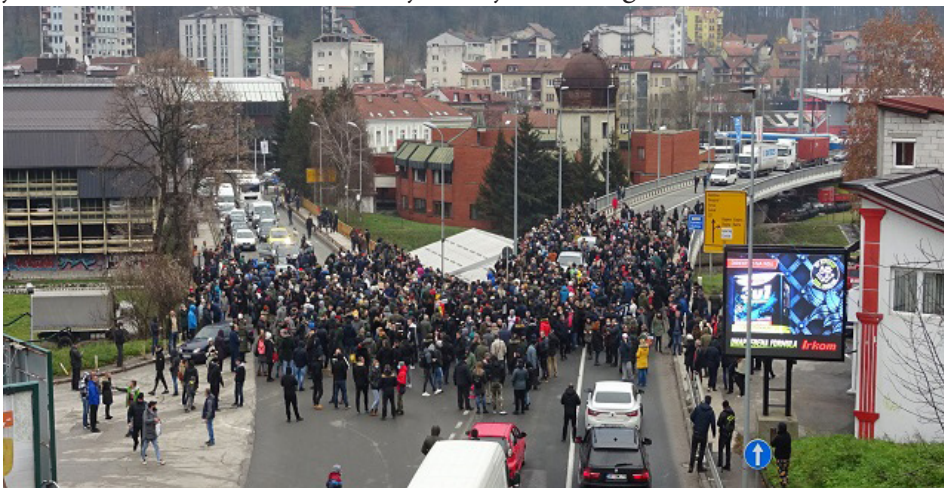
Blokada saobraćaja na magistrali u Užicu - protest protiv Rio Tinta

Samo ujedinjeni, istrajni i složni imamo šansu za pobjedu u ovoj borbi, jer političari i gazde na svojoj strani imaju moć i državni aparat, dok mi, obični ljudi, u krajnjoj instanci, imamo samo jedni druge i naše sindikate.