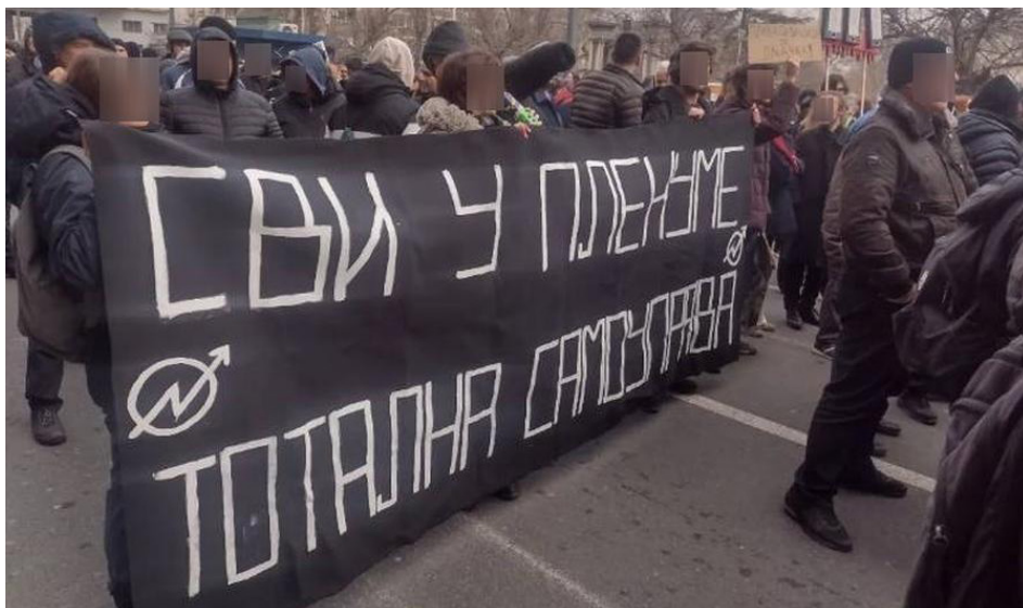
Fotografija sa protesta vozača GSP-a 05.02.2025.

Ukoliko do ispunjenja niti odgovora ne dođe, radnici i radnice najavljaju generalni štrajk svih zaposlenih u GSP-u. Ovo javno komunalno preduzeće koje treba da služi svima nama godinama se sistematski urušava, a zatim se to katastrofalno stanje koristi kao izgovor za sklapanje pogubnih tzv. privatno-javnih