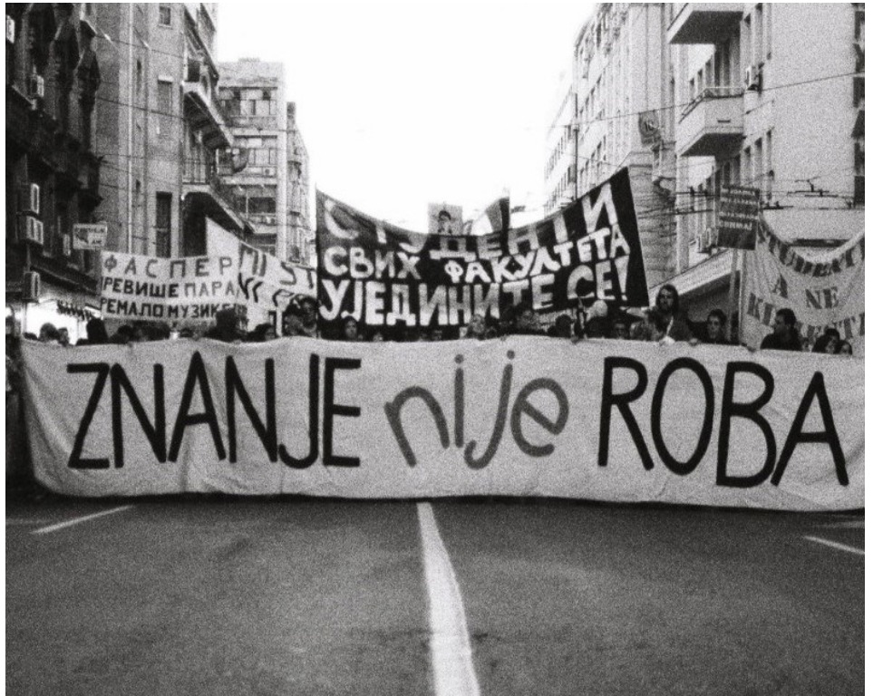
Fotografija sa studentskih protesta za besplatno obrazovanje 2012. godine.

Nama se, sa druge strane, ispiraju mozgovi da to tako i treba da bude i da su ljudi koji studiraju najbolji i najvredniji među nama