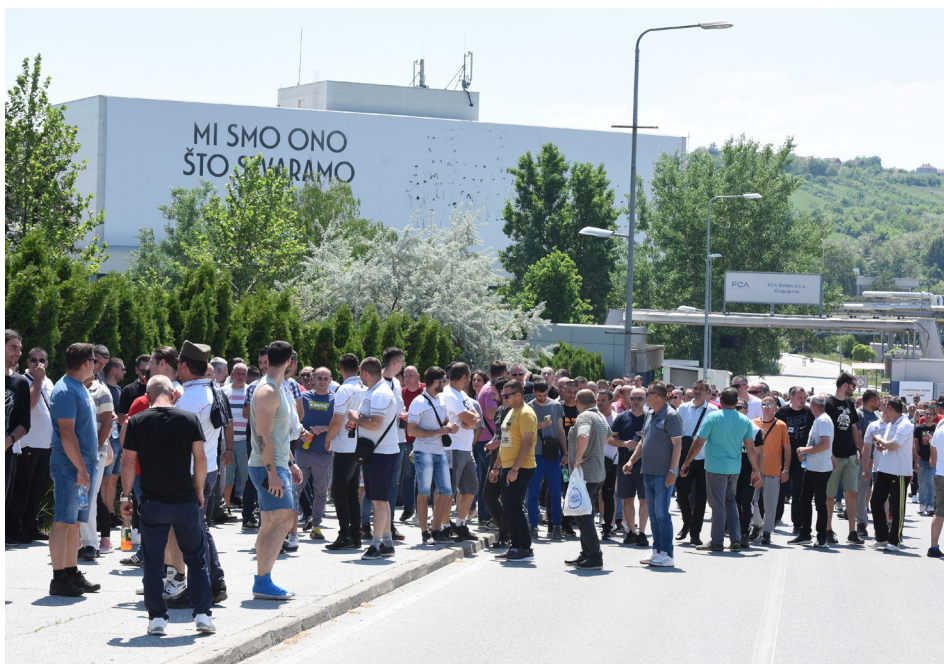
Protest radnika FIAT-a ispred fabrike, 13.05.2022.

U potpunosti podržavamo borbu radnika FIAT-a protiv ovog kriminalnog ultimatumu između otkaza i višegodišnjeg rada u inostranstvu. Smatramo da radnici FIAT-a iz Kragujevca treba da nastave sa protestima sve dok se njihovi zahtevi ne ostvare u praksi. Nadamo se da će biti pažljivi u vezi sa tim da sindikalne birokrate ne ugovore loše uslove u njihovo ime, kao i da će u tom slučaju stupiti u još snažnije i radikalnije proteste!